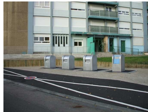
Test conteneurs enterrés depuis Juillet 2008

Développement de la collecte par conteneurs enterrés ou semi-enterrés pour l'habitat collectif